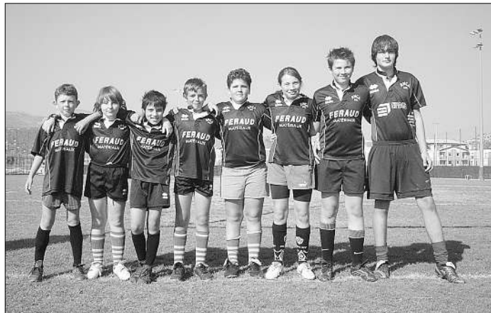
Les jeunes des classes sportives à horaires aménagés du Parc-Impérial.