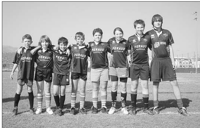
Les jeunes des classes sportives à horaires aménagés du Parc-Impérial.